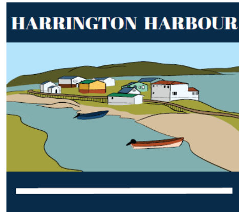
Harrington Harbour : Rowsell House