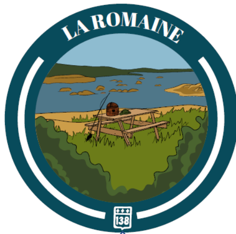
La Romaine : Centre d'interprétation