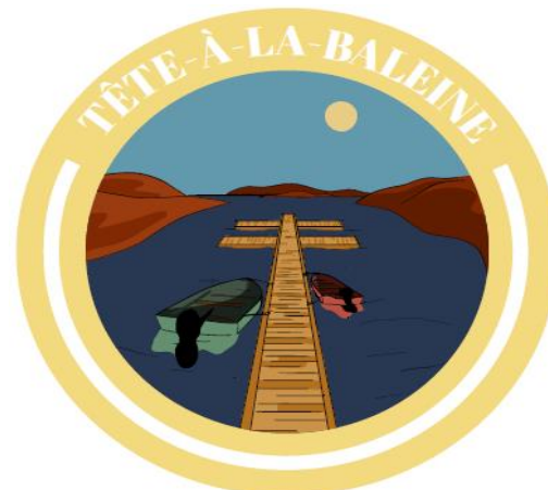
Tête-à-la-Baleine : Association touristique