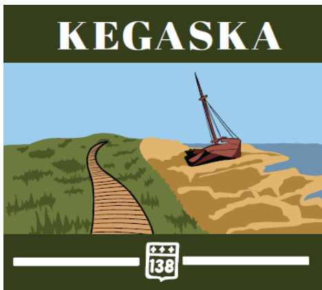
Kegaska : Welcome center

Voici les illustrations et l'endroit pour se les procurer: